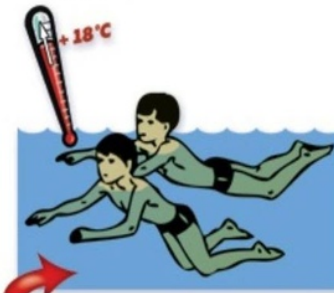
Купаться в воде при температуре ниже 18°C