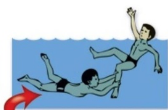
Устраивать на воде опасные игры