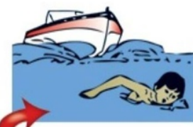
Подплывать к близко идущим судам, лодкам и катерам

При возникновении чрезвычайных ситуаций на воде обращайтесь за помощью к спасателям на пляже или звоните по телефонам: 01, 112