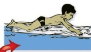
Кататься на самодельных плотках