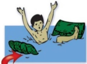
Далеко отплывать от берега на надувных матрацах и кругах