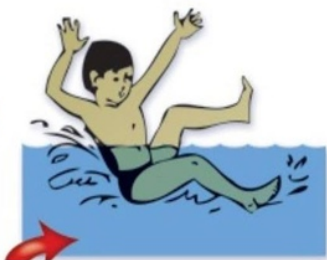
Подавать ложные сигналы тревоги