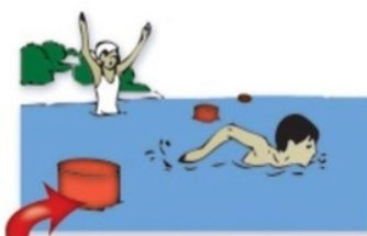
Заплывать за буйки или пытаться переплыть водоемы